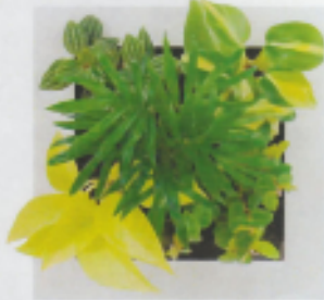
「ホワイト13」 ペペロミア・プティオラータ オキシカルジューム・ブラジル テーブルヤシ ポトス・ライム フィカス・プミラ・緑