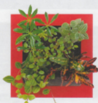
「レッド13」 シェフレラ・緑 ペペロミア・プティオラータ ワイヤープランツ ペペロミア・アングラータ クロトン・プッシュ&ファイヤー