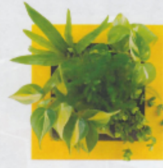
「イエロー13」 アビス ポトス アスバラガス・ブルモーサス オキシカルジューム・ブラジル ペペロミア・イザベラ