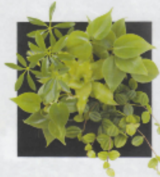
「ブラック13」 シェフレラ・緑 オキシカルジューム クリプタンサス・グリーン オキシカルジューム ペペロミア・アングラータ