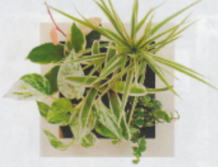
「アイボリー13」 ホヤ・カルノーサ コンシンネ・ホワイボリー ネオレグリア・白 ポトス・マーブル フィカス・プミラ・研入り