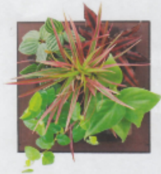
「アンバー13A」 ペペロミア・プティオラータ クリプタンサス・レッド コンシンネ・レインボー フィカス・プミラ・緑 オキシカルジューム